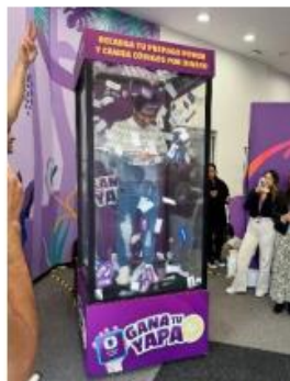
Imagen referencial de la cabina de premios