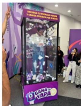
Imagen referencial de la cabina de premios