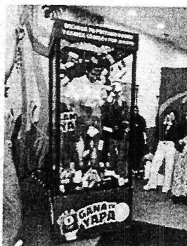
Imagen referencial de la cabina de premios