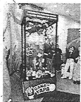
Imagen referencial de la cabina de premios